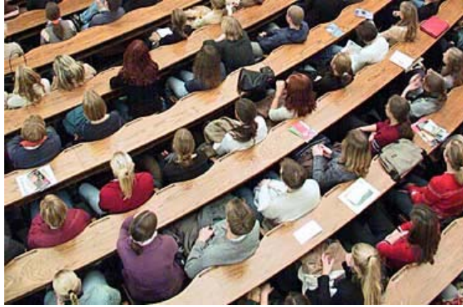
Students in a lecture hall