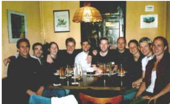
Gesellschaft in einer Kneipe