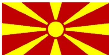
Bivša Jugoslovenska Republika Makedonija (FYR of Macedonia)