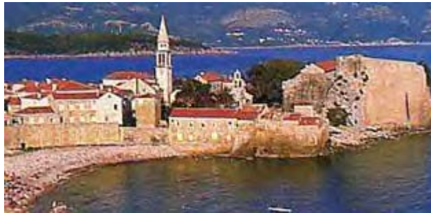
Stari grad Budva ( the Old Town Budva )

Будванска ривијера се налази у средњем делу Црногорског приморја. Њена површина износи 122 квадратна километра. Будва има 17000 становника. Највеће општине су Будва, Петровац, Свети Стефан и Бечићи. Будва има медитеранску климу са благим зимама и веома топлим летима. Средња температура у јануару износи 8°C, а у јулу 24°C. Број сунчаних сати је 2300 годишње. Температура мора у фебруару износи 11,7°C, а у августу 24,7°C.