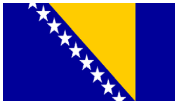
Bosna i Hercegovina (Bosnia and Herzegovina)