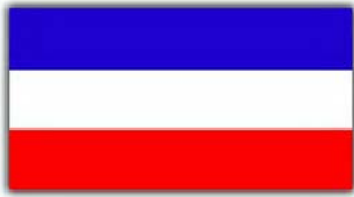
Savezna republika Jugoslavija (Federal Republic of Yugoslavia)