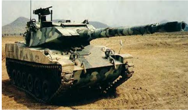
Стингреј – лаки тенк

Командо Стингреј је веома лаган тенк и извози се у разне земље света. Његов развој је почео у јануару 1983. године у Америчкој фирми Кадилак. Први прототип је направљен у августу 1984. године. Два месеца после извршена су и прва испитивања. Прототип је послат у Тајван 1986. године, а у октобру 1987. армија Тајвана је купила 108 нових тенкова.